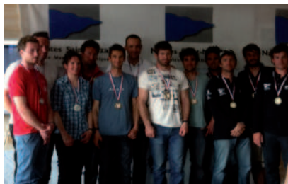
Les équipages finalistes en voile

Coup de coeur de «La Lettre de l'O M S» pour les championnats de France de Match-Racing organisés par l'A